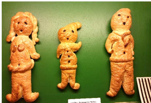
Gebildbrot Weckpuppe zum Nikolaus