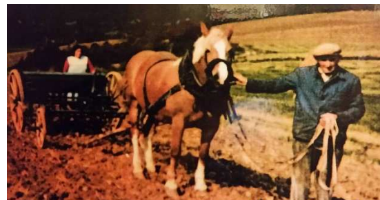
Drill- oder Sämaschine