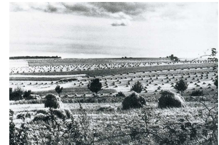
Felder nach der Getreideernte