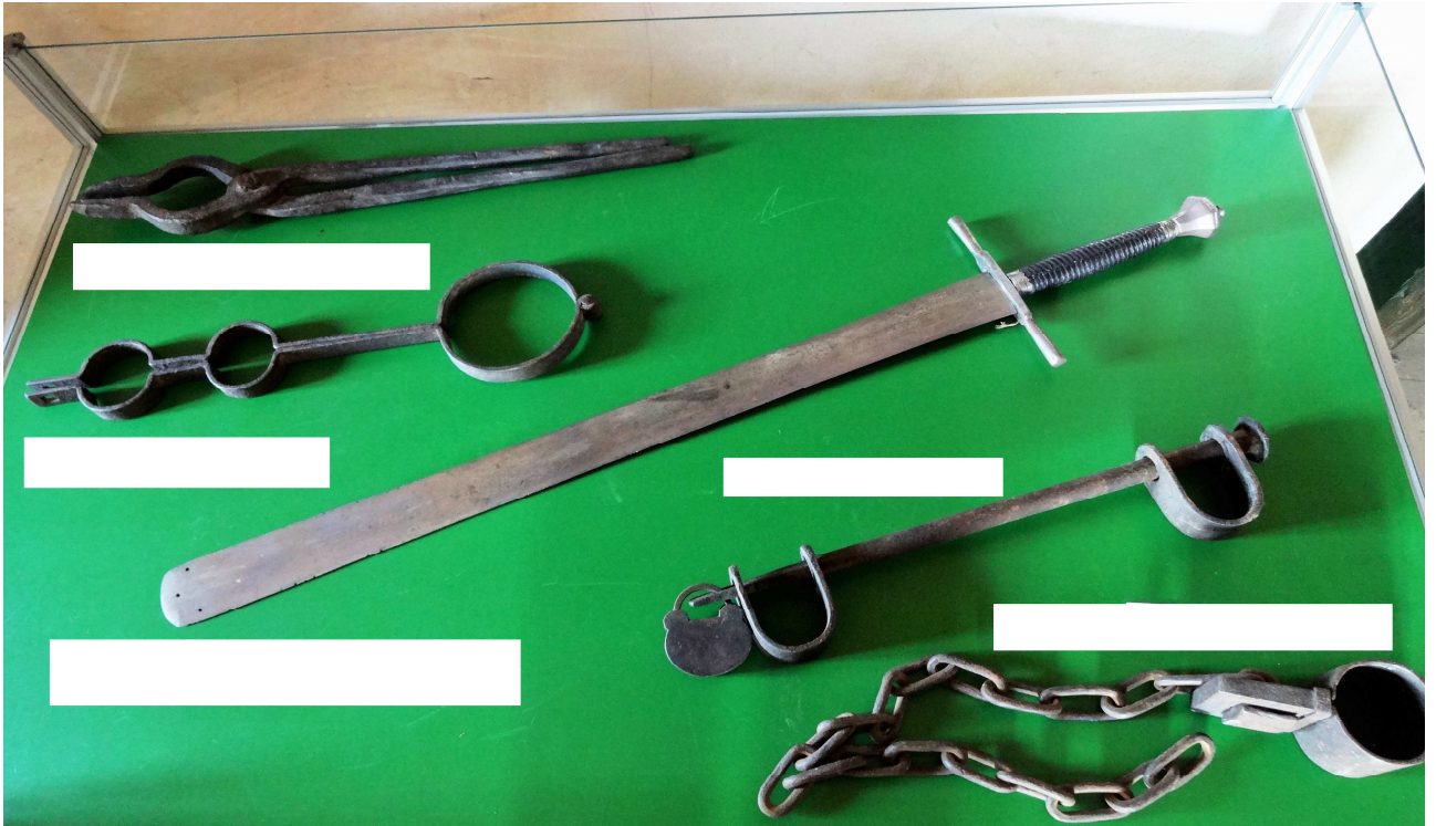
Setze richtig ein: Richtschwert, Halsgeige, Armfessel, Beinfessel, Folterzange